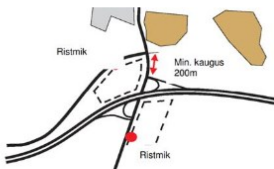
Pilt 14. Maakasutuse ristmik peabasuma eritasandilisest ristmikust piisavalt kaugel

Väljavõte Soome juhendist Maanteed planeeringus :